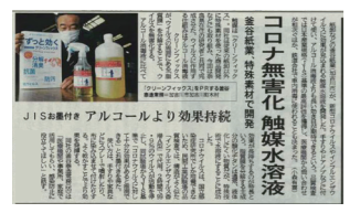
神戸新聞 2020年5月21日掲載

検査機関での試験鑑定で効果が証明されています 抗ウイルス・抗菌・防臭に関して検査機関での試験で裏付けられました ※すべてのウイルス、菌に対して効果があるわけではありません