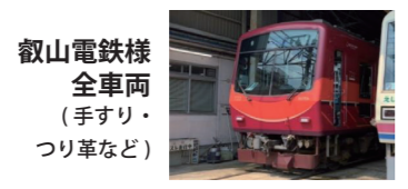
叡山電鉄様 全車両 (手すり・ つり革など)