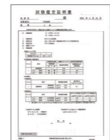
●特定ウイルス 一般財団法人 ニッセンケン品質評価 センター JIS抗ウイルス効果の 最高評価