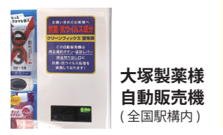
大塚製薬様 自動販売機 (全国駅構内)