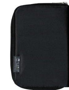
15 ブラック JAN 4982502-05389-9