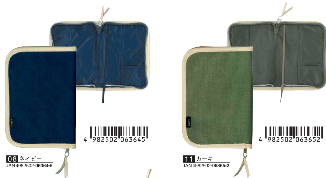
08 ネイビー JAN 4982502-06364-5

114026 New Item! ●ブックカバー ラウンドジップ・ハンブ ●タテ185mm×ヨコ125mm (文庫本サイズ) 内容●素材: ハンブ・ナイロン・ポリエステル等 税別価格 ¥1200 出荷単位 3 CT90