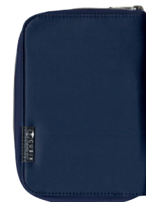
08 ネイビー JAN 4982502-05388-2