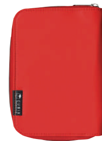
05 レッド JAN 4982502-05388-8

本を傷めず持ち歩ける ラウンドジップタイプ (文庫本約700ページまで使用可能)