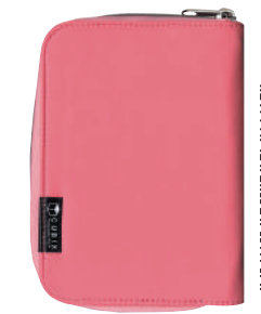
06 ピンク JAN 4982502-05387-5