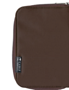
35 ダークブラウン JAN 4982502-05390-5